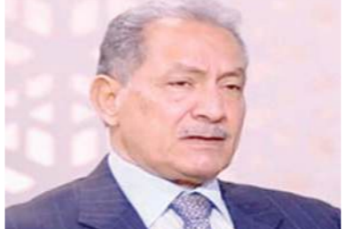
السفير صلاح حليمه