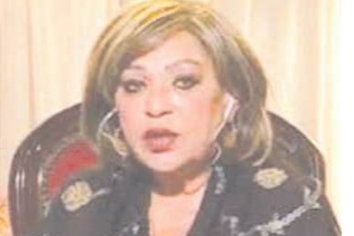
السفيرة منى عمر