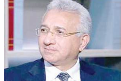
السفير محمد حجازي