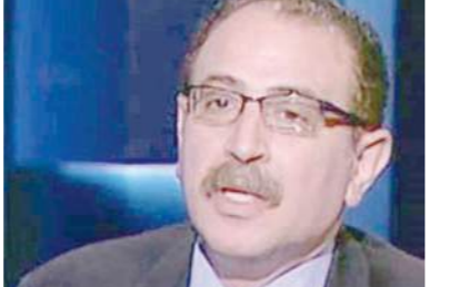
د. طارق فهمي

أشارت السفيرة منى عمر مساعد وزير الخارجية الأسبق إلى أن زيارة الرئيس السيسي إلى العاصمة الإريترية أسمرا والقمة الثلاثية تأتي في إطار الحرص على دعم العلاقات من دول القرن الإفريقي وتأتي أهمية الزيارة أن هناك حرصاً من مصر على أن تدعم علاقاتها بكافة الدول في القرن الإفريقي وكانت هناك زيارات أيضاً من رئيس الصومال وعدة وزراء من الصومال لصر خلال الفترة الماضية وكذلك زيارات من وزراء إريتريا وجيبوتي فالعلاقات بين مصر وجيبوتي قوية والاتصالات مع الرئيس الكيني تفضى بشكل دائم، فمصر على تواصل مع كافة الدول الموجودة في منطقة شرق إفريقيا والقرن الإفريقي وكذلك السودان وجنوب السودان، حيث قام الفريق البرهان رئيس المجلس الانتقالي العسكري للسودان بزيارة إلى إريتريا الاثنين الماضي، وهذا يوضح أن هناك منطقتة متكاملة للتعاون بين دول القرن الإفريقي تشوهدا مصر خلال الفترة الحالية، ولذلك توقيت الزيارة في غاية الأهمية من أجل تهدئة والاستقرار في هذه المنطقة مقابل ما تعاني منه في منطقة الشرق الأوسط من تأجج ودمار يقوم به المحتل الإسرائيلي.