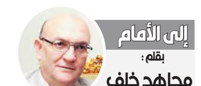
إلى الأمام بقلم: مجاهد خلف

الأقوياء.. فقط! جديدة الرئيس السيسي، فرأينا كيف يمكننا التصنيع بل تنفق على الصانع نفسه، وعلمنا أن نعلمي الثقة للشباب القادر والفاهم حتى ندير منتجاتنا في الأسواق العالمية، صدقوني كلها مشوار قليلة ونغزو العالم.. المهم أن يكون لدينا الفكر والجاهد ولا نخاول أن نفضّل الناحج، بل علمنا أن نقف جميعاً في صفه حتى ينتج لنا ما نريد.. صدقوني، بهذه الطريقة سوف نهض وستكون لنا مع