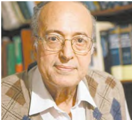
عبد الوهاب المسيري

«على مدى عامين من الحرب» أن ما فعله إسرائيل يمكن أن يهدد مصالحها في الشرق الأوسط.. وأوقفت أمريكا الحرب عندما استدركت هي تداعياتها.. أما إذا كانت تحركات إسرائيل مهددة للمصالح الأمريكية فإن «واشنطن» تتحرك على الفور لكبح جماح الجنون الإسرائيلي.. هنا تكون مصلحة أمريكا «أولا».. ثم النظر إلى مصلحة «إسرائيل» بعد ذلك.. «لغة المصالح» في كثير من الأحيان تأتي بردود أمريكية مفاجئة وربما صادمة لإسرائيل!!.. من يؤثر في مصالح أمريكا يمكنه أن «يفرمل» حركة إسرائيل.. ومن يمتلك قوة الردع يستطيع أن يوقف تمدد «أوهام» إسرائيل!!! في كتابه «الأيديولوجية الصهيونية».. يكشف العلامة الموسوعة الدكتور عبد الوهاب المسيري طبيعة العلاقة بين إسرائيل وبين معنى ومفهوم «السلام».. ويشير في ذلك إلى ارتباط الشخصية الإسرائيلية أو الشخصية الصهيونية بالعنف.. ارتباطا عميقا.. يشير المسيري في ذلك إلى أن