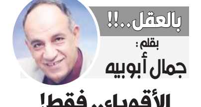
بالعقل...!! بقلم: جمال أبوويه

المصري.. فالعكس صحيح.. فالقوضى والانفلات والإرهاب هم طريق الشيطان إلى الهدم والدمار والتخلف لعقود طويلة عن ركب التقدم وأهدار الوقت والموارد وثروات البلاد.. وإذا نظرنا إلى الدول التي أسقطتها القوضى نسأل كم تحتاج من مليارات الدولارات لتعود كما كانت على الأقل أو أصحاراً دمرت المخططات والمؤامرات بإشاعة القوضى.. هناك دولة منذ سنوات كانت تحتاج لأكثر من 400 مليار ومصر أيضاً التي نجت من مخطط القوضى خسرت ما يصل إلى 450 مليار دولار واحتاجت لوقت حتى تعود وتكفله بأهظة إصلاح ثروات طائلة وممازالت تقع تحت براثن القوضى والانقسام وتخضع لمليشيات الإرهاب.. لذلك فإن الأمن والاستقرار هما القاعدة التي تنطلق منها التنمية ويرتكز عليها التقدم. ثالثاً: الأمن والأمان والاستقرار هم الأساس لقوة الداخل وهي التي تشكل قوة الخارج.. فما كان لمصر أن تستعيد مكانتها ودورها وتقلها الإقليمي والدولي لولا أن شعبها على قلب رجل واحد يتمتع بأعلى درجات الوعي والأصطفاف وهو ما أتاح لها أن تستثمر في القدرة الشاملة ومنها قوة الدور والنقل والتأثير بل أقول إن نجاح مصر في إنهاء الحرب الإسرائيلية على قطاع غزة ومواقفها القوية هو ثمرة طبيعية لمناخ الأمن والاستقرار الذي أدى إلى تعاظم قوة وقررة الدولة الشاملة فلم تجرؤ أي قوة على فرض أمر أو غلبها أو تجاوز خطوطها أو الاعتداء على أراضيها وحودها أو انتهاك سيادتها.