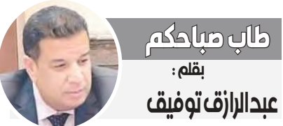
طاب صباحكم بقلم: عبدالرازق توفيق

ملاحظة مهمة دهاء الأسباب «...منا».. إذا قام على يقين الذكر بالله..