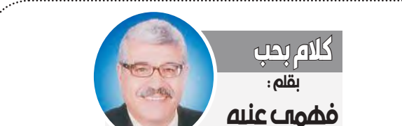
كلام بحب بقلم: فهمه عنبه

مشروع صغير فى كل بيت بدعم الحكومة لمواجهة الغلاء!!