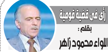
أنا في قضية هوية بقلم: اللواء محمود زاهر

ثانياً: الأمن والأمان والاستقرار هو الطريق والسيبل الأمثل لبناء القدرة الشاملة سياسيا واقتصاديا وعسكريا وأمنيا واجتماعيا. فما كان لمصر أن تحقق هذه النجاحات والإنجازات والقوة والقدرة إلا بما لديها من أمن واستقرار وتصبح قوة إقليمية عظمى وتحظى بمستقبل واعد ومتاح لها تحقيق قوة وجاهزية جيشها الوطني ونشرها الوطنية والاستثمار باستمرار في بناء الدولة الوطنية وبناء الإنسان