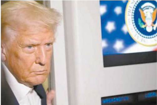
الولايات المتحدة الأمريكية.

ومن المقرر أن يلتقى الرئيس الأمريكى مع امبراطور اليابان ويوزر القوات الأمريكية ويلتقى بقيادة أعمال يابانيين وذلك قبل اجتماعه مع رئيسة الوزراء اليابانية الجديدة ساناى تاكاشيتي.