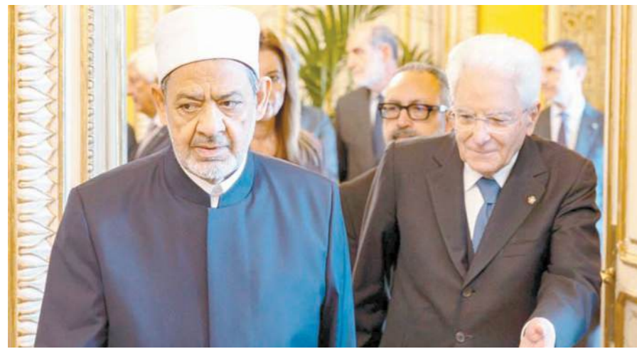
شيخ الأزهر للرئيس ماثريلا: ننتظر اعتراف إيطاليا بدولة فلسطين